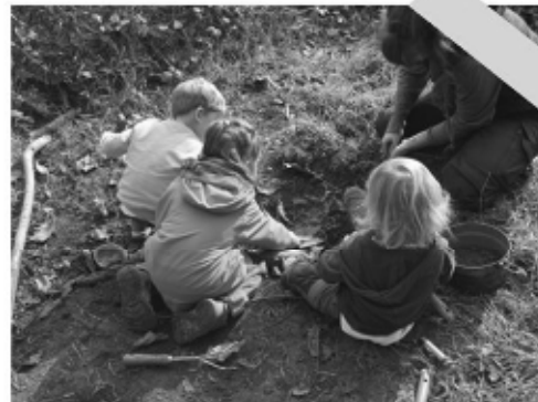
Kinderhaus Löwenzahn