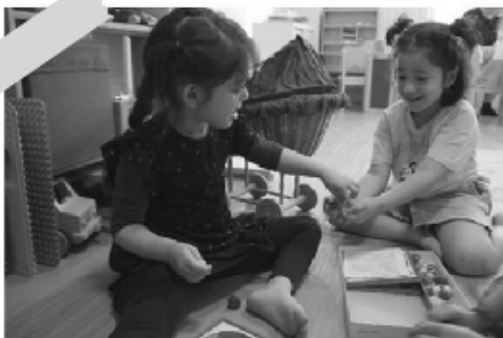
Spielgruppe Rasselbandi

Ihr Kind wird im August 2026 in den Kindergarten eintreten. Damit dieser wichtige Schritt gelingt, sollten alle Kinder gut Deutsch sprechen können, um leichter am Kindergartenalltag teilnehmen und sich gut entwickeln zu können. Die Sprachstanderhebung ist ein wichtiger Beitrag, mehr Chancengerechtigkeit für alle Kinder beim Schulstart zu fördern.